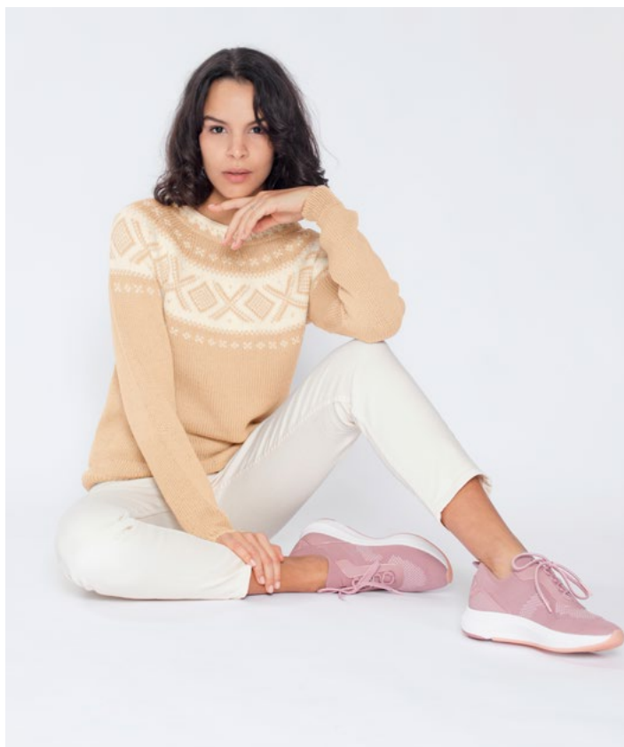
Se også i vanilje | DG410-03