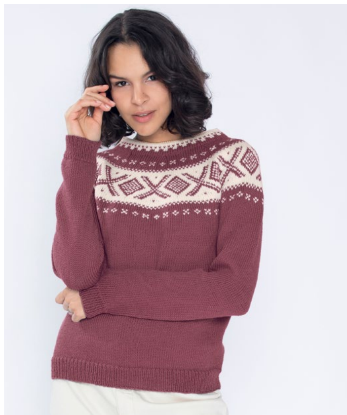
Se også i plomme | DG410-04